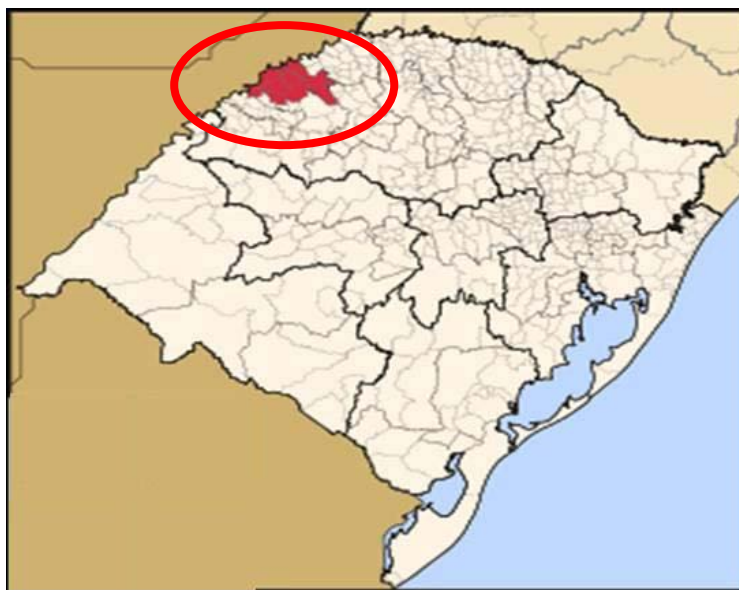
Figura 2 – Mapa da região Fronteira Noroeste do Rio Grande do Sul.