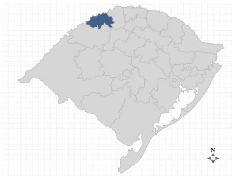
Figura 1 – Mapa das regiões do Estado do Rio Grande do Sul

Na Figura 1, pode-se observar a divisão das regiões do Estado do Rio Grande do Sul, sendo que a Região Fronteira Noroeste Rio-grandense está em destaque.