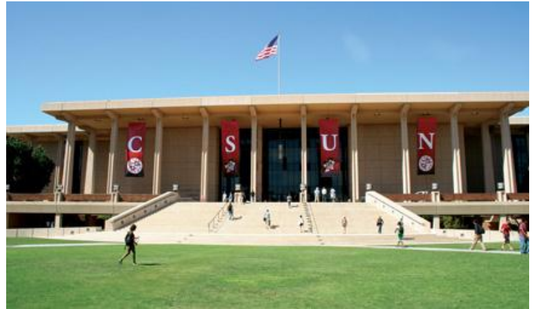
Biblioteca Central da California State University