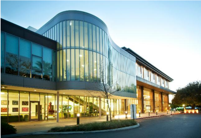
New Campus Center da University of La Verne