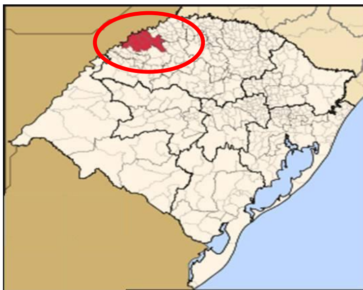
Figura 2 – Mapa da região Fronteira Noroeste do Rio Grande do Sul.